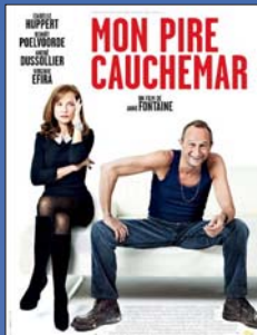
Mon pire cauchemar

jeudi 19 janvier à 20 h 30 dimanche 22 janvier à 15 h 00