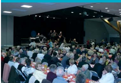
infos seniors (p.16 et 17)