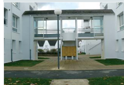
place Paul Langevin boulevard Voltaire rue Romain Rolland