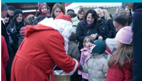
vie locale (p.14 et 15)