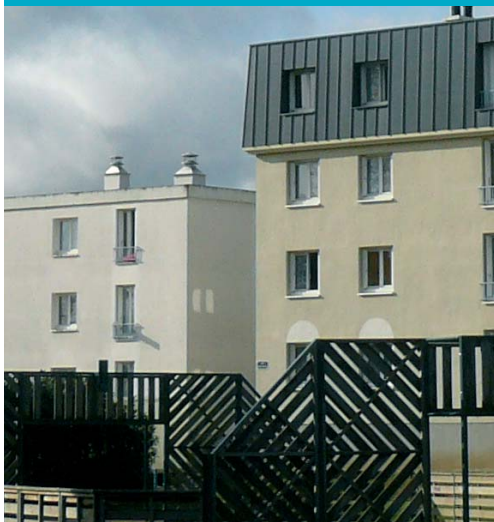
dossier - logement et cadre de vie (p.5)