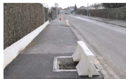
trottoirs rue R. Barthélémy : dessouchage d'arbres, réfection et, côté impair plantation d'arbres.