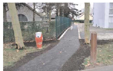
sécurité avec la réfection du trottoir et le remplacement de la clôture tout autour de l'enceinte de l'école du Château