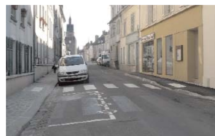
rue A. Briand : confection d'un trottoir pour l'accessibilité, avancée du passage piéton et création d'une "place handicapés"