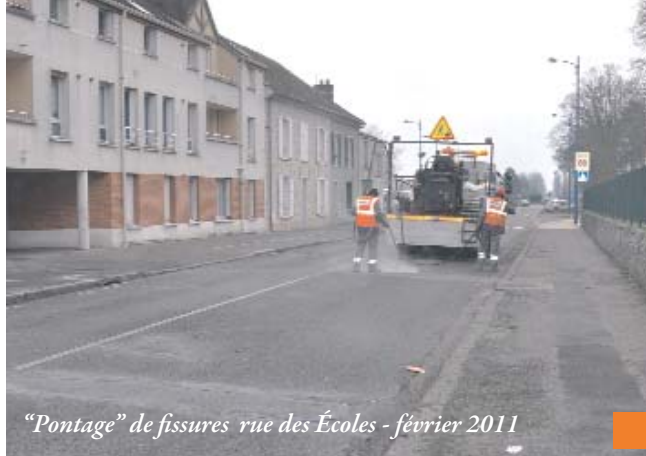
"Pontage" de fissures - rue des Écoles - février 2011

La signalisation routière réglementaire a été mise en place par les services de la commune de Nangis.