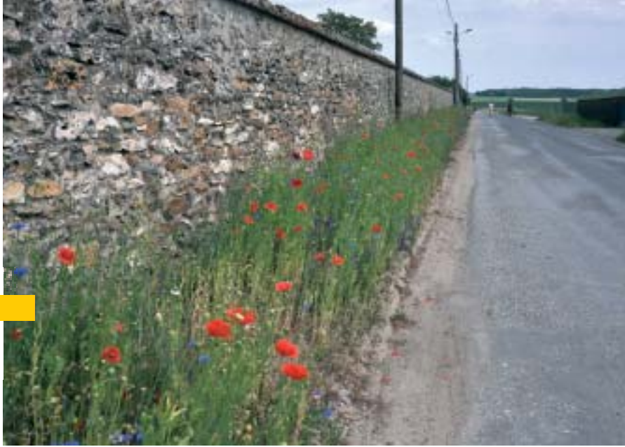
première prairie fleurie à Nangis, le long du mur du cimetière

raison, plantes vivaces, graminées...) accompagnés d'un paillage sont favorisés.